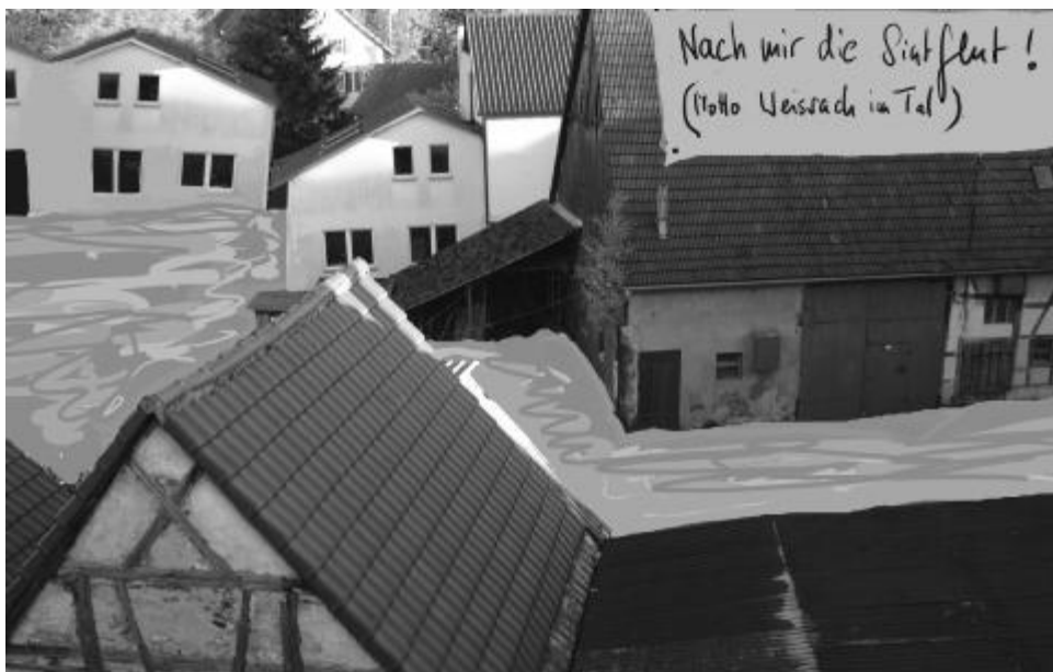
Nach mir die Sintflut von Claudia Gollor- Knüdeler