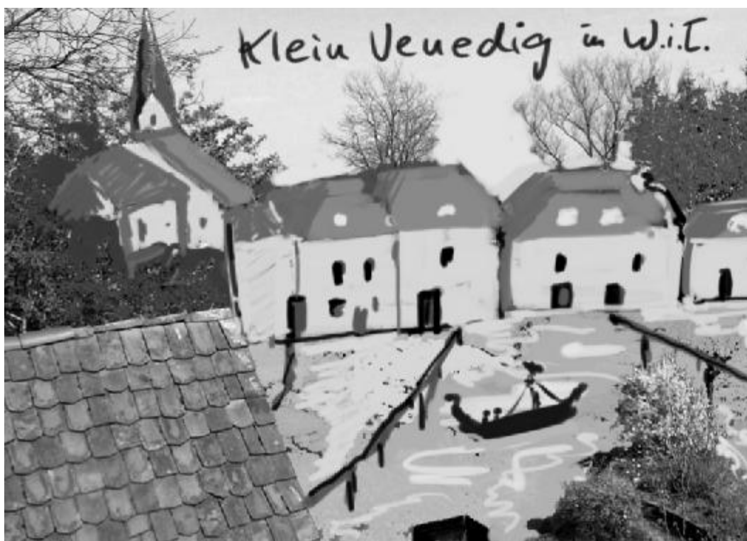
Klein Venedig in W.i.T. von Claudia Gollor-Knüdeler