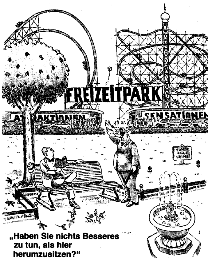
„Haben Sie nichts Besseres zu tun, als hier herumzusitzen?“

Jugendliche fühlen sich oft als die Ungeliebten in unserer Gesellschaft. Andererseits fällt es ihnen bisweilen nicht leicht, die Bedürfnisse anderer zu respektieren. Was könnte, wenn man beides bedenkt, für diese Altersgruppe entstehen?